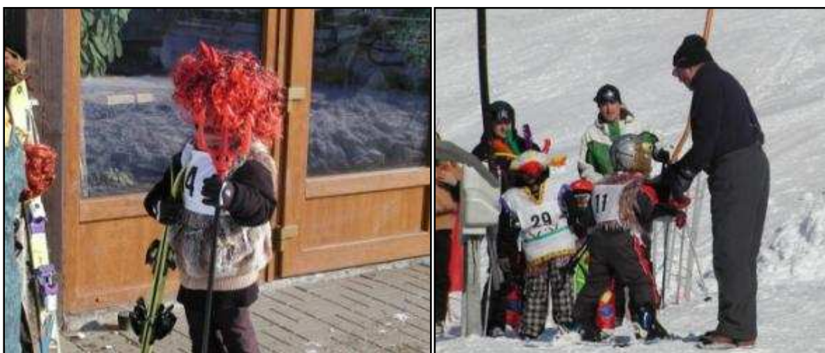
Startovní pole (SKI areál Meziboří, 26.2. 2011)