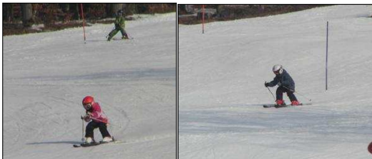
Trénink oddílu, 27.2.2011