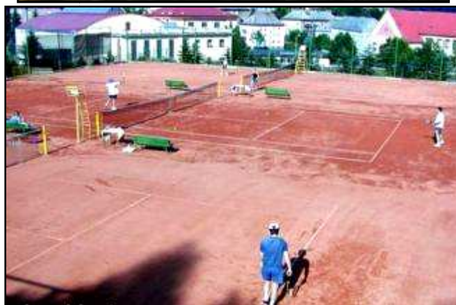
Hokejbalové hřiště a tenisové kurty