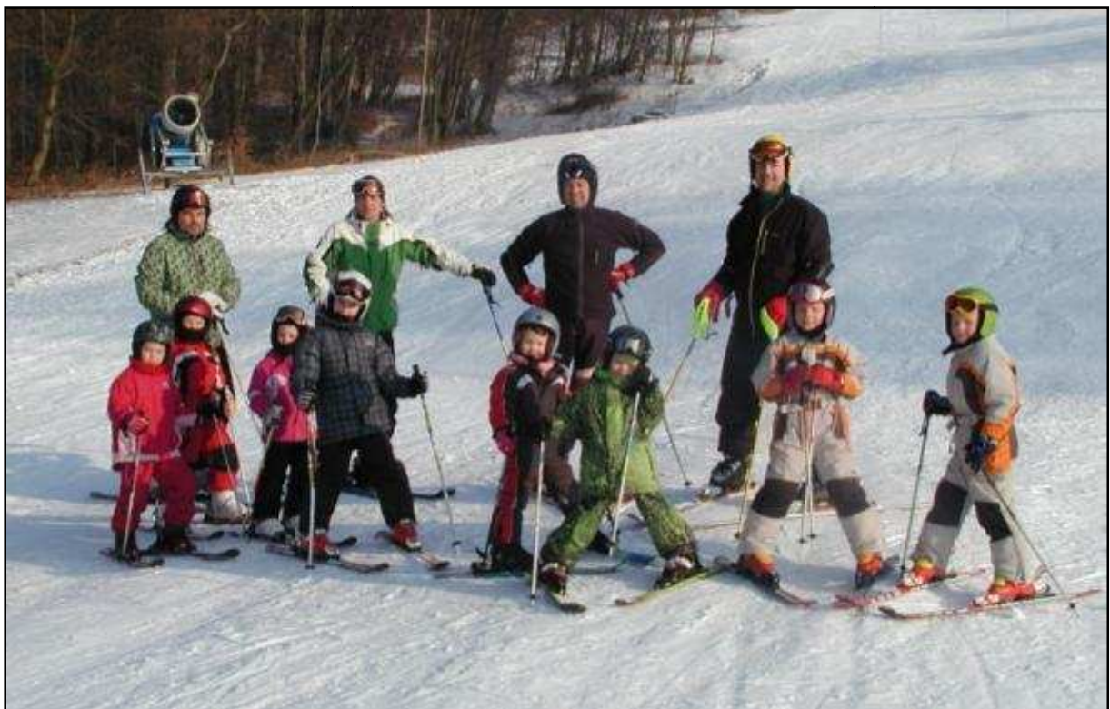
Lyžařský oddíl, 27.2.2011