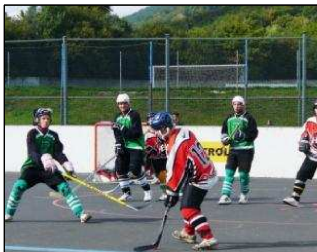
2. čtvrtfinále Meziboří - Bazy

Jarní část sezony 2010/2011 skončila pro oddíl hokejbalu TJ Baník Meziboří, dalo by se říct již tradičně, v úvodním kole play-off. Meziboří skončilo po základní části na 6. místě, což nebyla nejhorší pozice, ale v prvním kole narazili hokejbalisté na velmi silného soupeře HBC Bazy Děčín. První zápas na domácím hřišti soupeře v Ústí nad Labem byl velmi vyrovnaný a přinesl vše co se dá od čtvrtfinálového zápasu