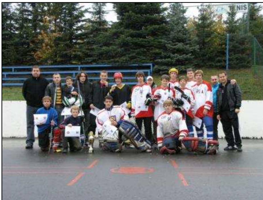
Účastníci a organizátoři turnaje mládeže 1. Schönbach Cup