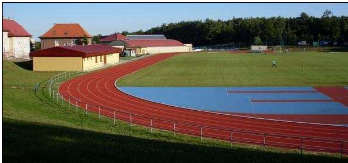
Atletický areál TJ Baník Meziboří s nově postavenou budovou zázemí