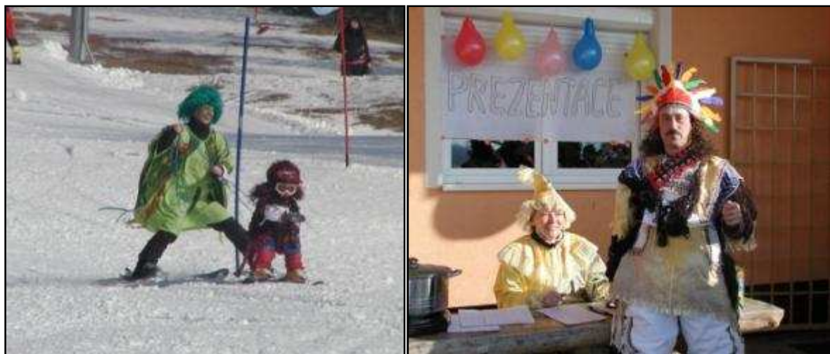
Startovní pole (SKI areál Meziboří, 26.2. 2011)