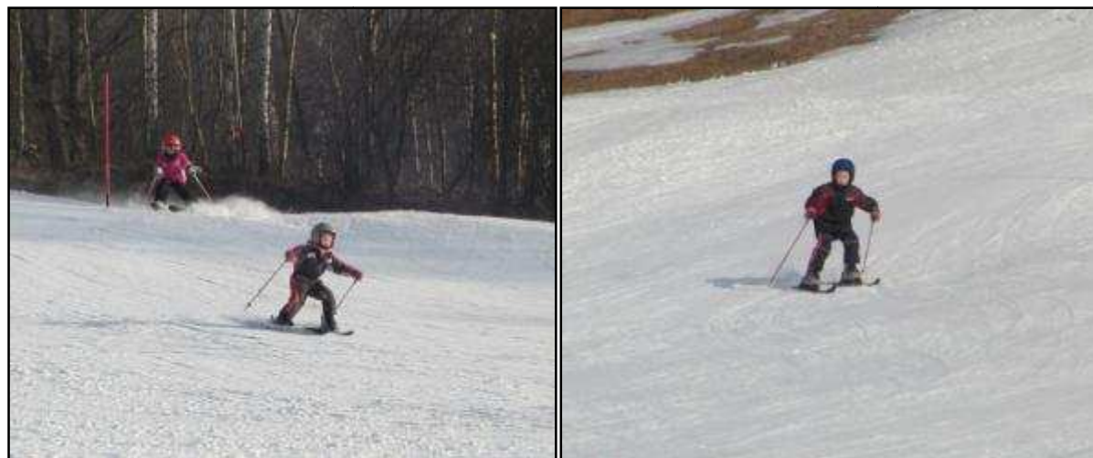
Trénink oddílu, 27.2.2011