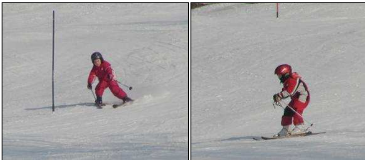
Trénink oddílu, 27.2.2011