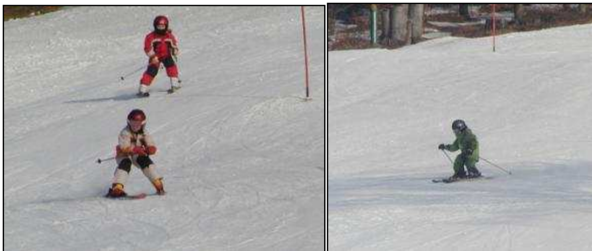
Trénink oddílu, 27.2.2011