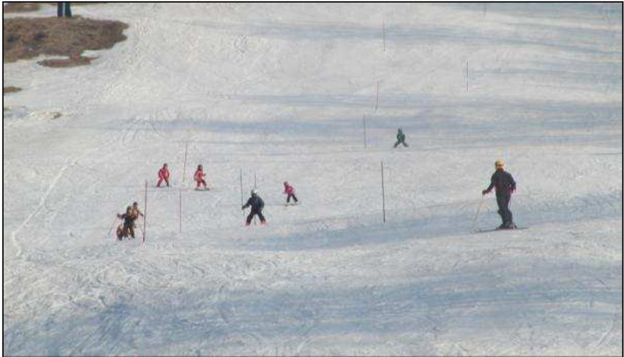
Trénink oddílu, 27.2.2011