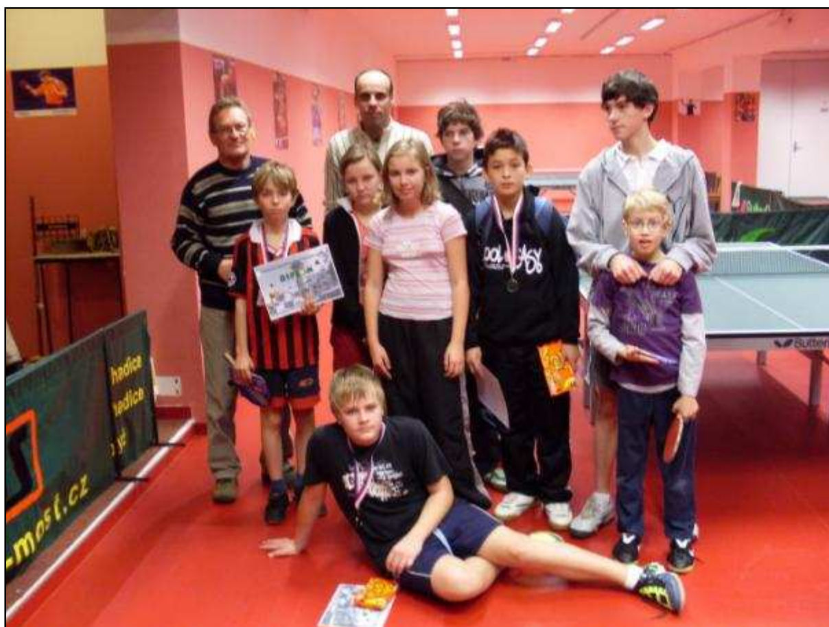
výprava – turnaj Most 20. 12. 2011