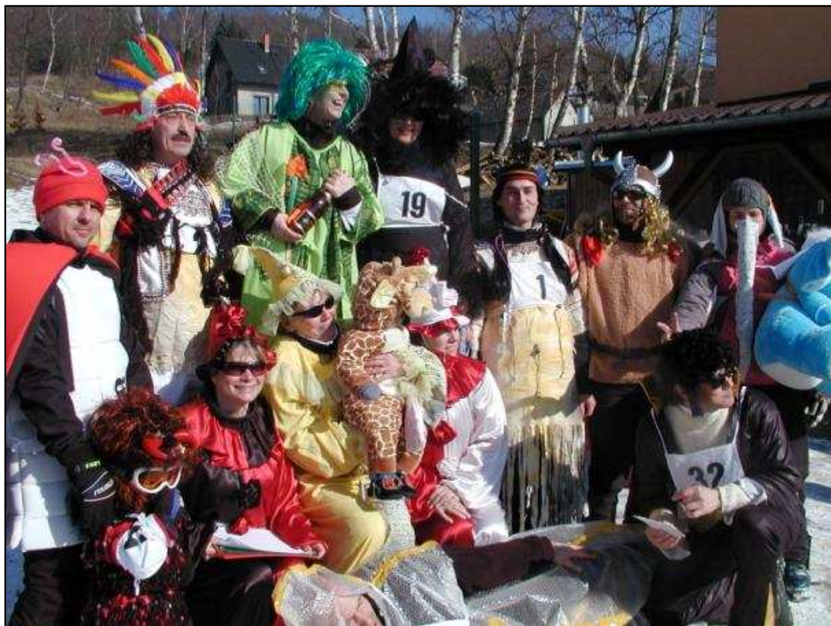
Vyhlášení nejlepších masek (SKI areál Meziboří, 26.2. 2011)

Lyžařská sezóna byla ukončena v prvním týdnu měsíce března. Během léta a podzimu byl areál podroben důkladným opravám a rekonstrukcím. Byla provedena kompletní obměna armatur vodního řádu pro umělé zasněžování. Technicky nevyhovující kulové ventily vodních šachet byly nahrazeny vodními hydranty HTM, které umožní kromě obnovení funkčnosti systému rovněž velmi snadnou konektivitu systému, a tím úsporu času na přípravu umělého zasněžování. Vedle této investičně významné akce se provedla standardní údržba areálu jako je příprava strojů a techniky, sekání sjezdovky, natěračské práce apod.