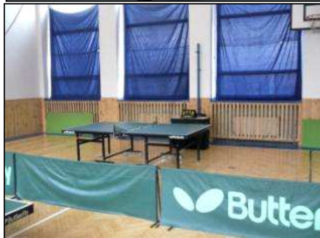
DOJO oddílu JUDO a herna stolního tenisu na ZŠ Meziboří