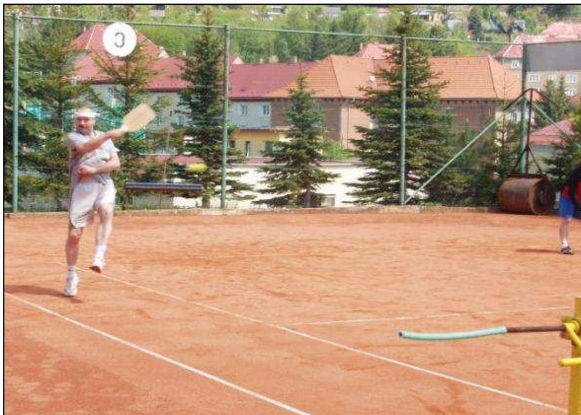
Turnaje dřevěných pádel se zúčastňují i ostatní členi Baníku a široké veřejnosti

Pravidelnou zajímavou akcí za účasti sponzorů je turnaj naložovaných dvojic. Přihlášení hráči rozdělí dle výkonnosti do dvou skupin a naložováním vznikne pár. Tento turnaj nikdy nemá jasného favorita a zápasy bývají dlouhé a vyrovnané.