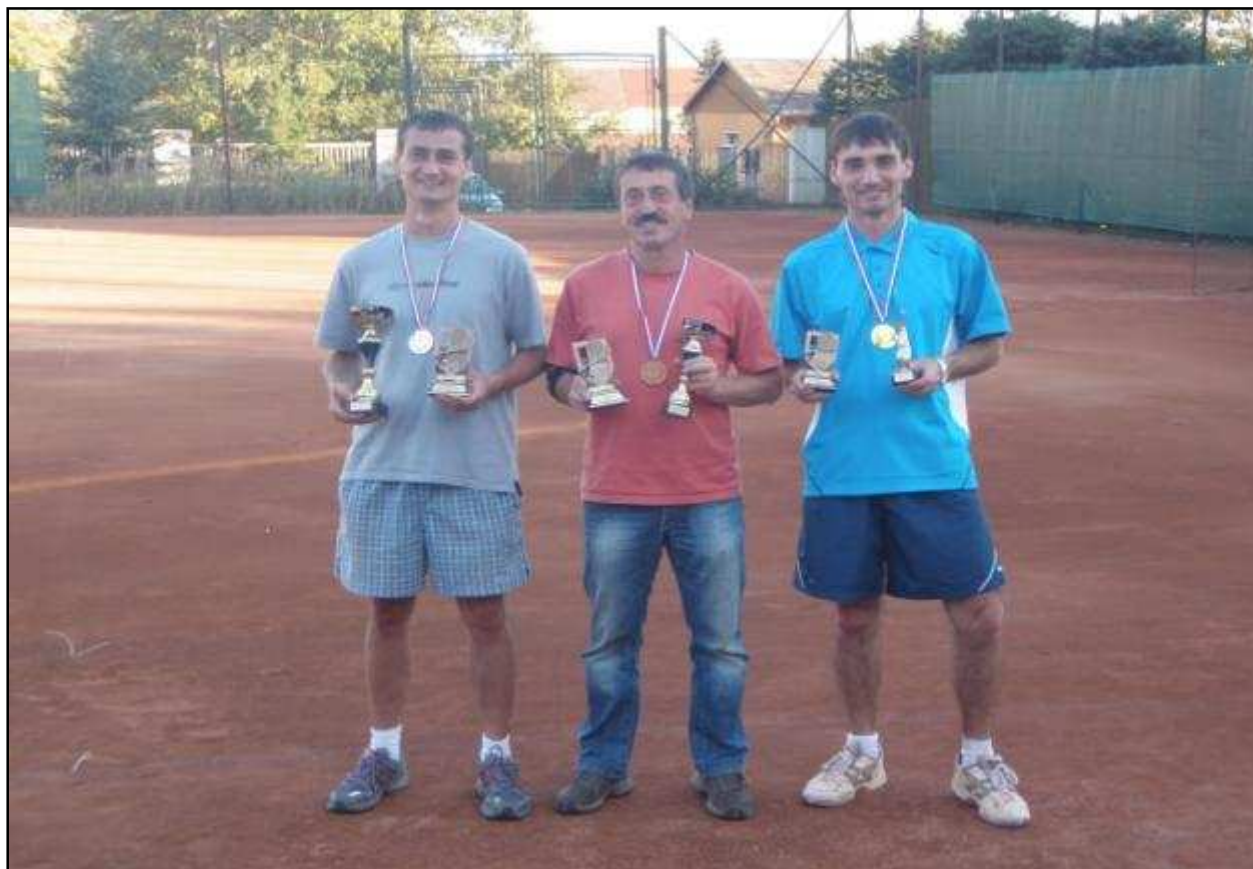
Turnaj v kaštanech