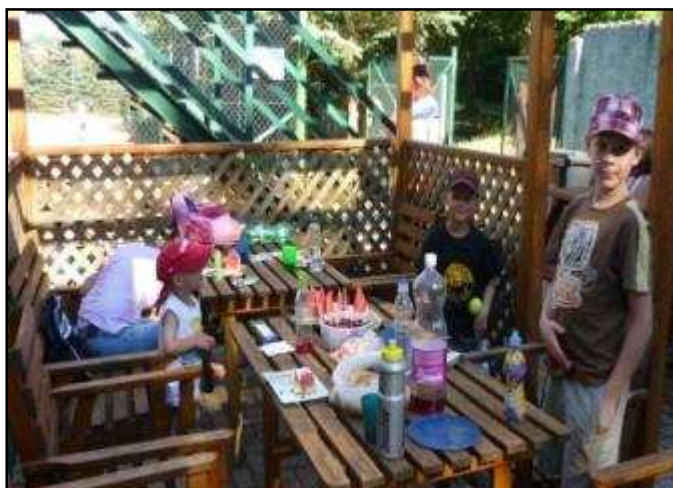
Ukončení školního roku