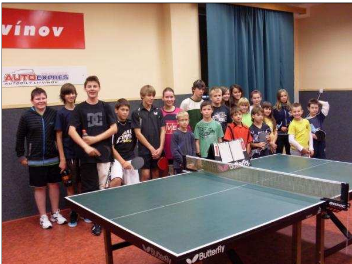
prezence – turnaj Litvínov 19. 10. 2011