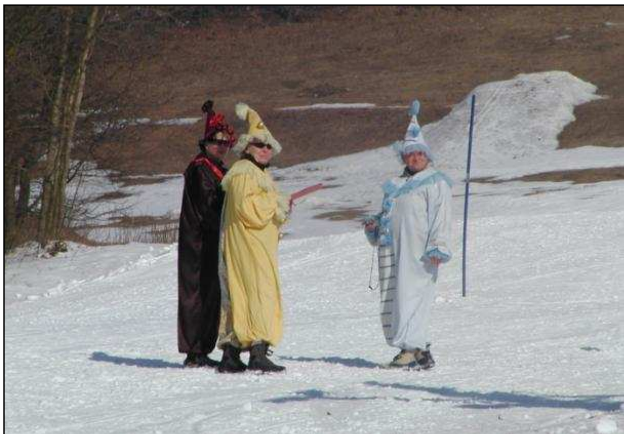
Organizátorky (SKI areál Meziboří, 26.2. 2011)