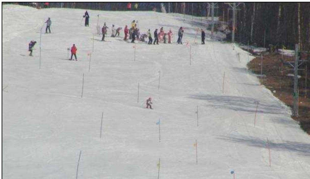
Závodní trať (SKI areál Meziboří, 26.2. 2011)