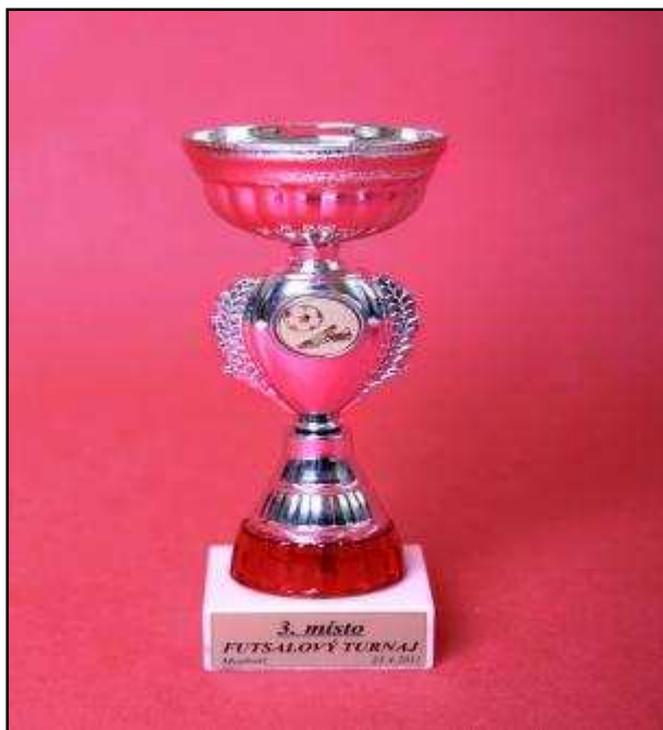
pohár týmu FK Baník

Další turnaj se konal v létě. 28. 8. 2011 a byl to turnaj nohejbalový. Zde byla účast převážně členů TJ Baník. Týmy byly smíšené.