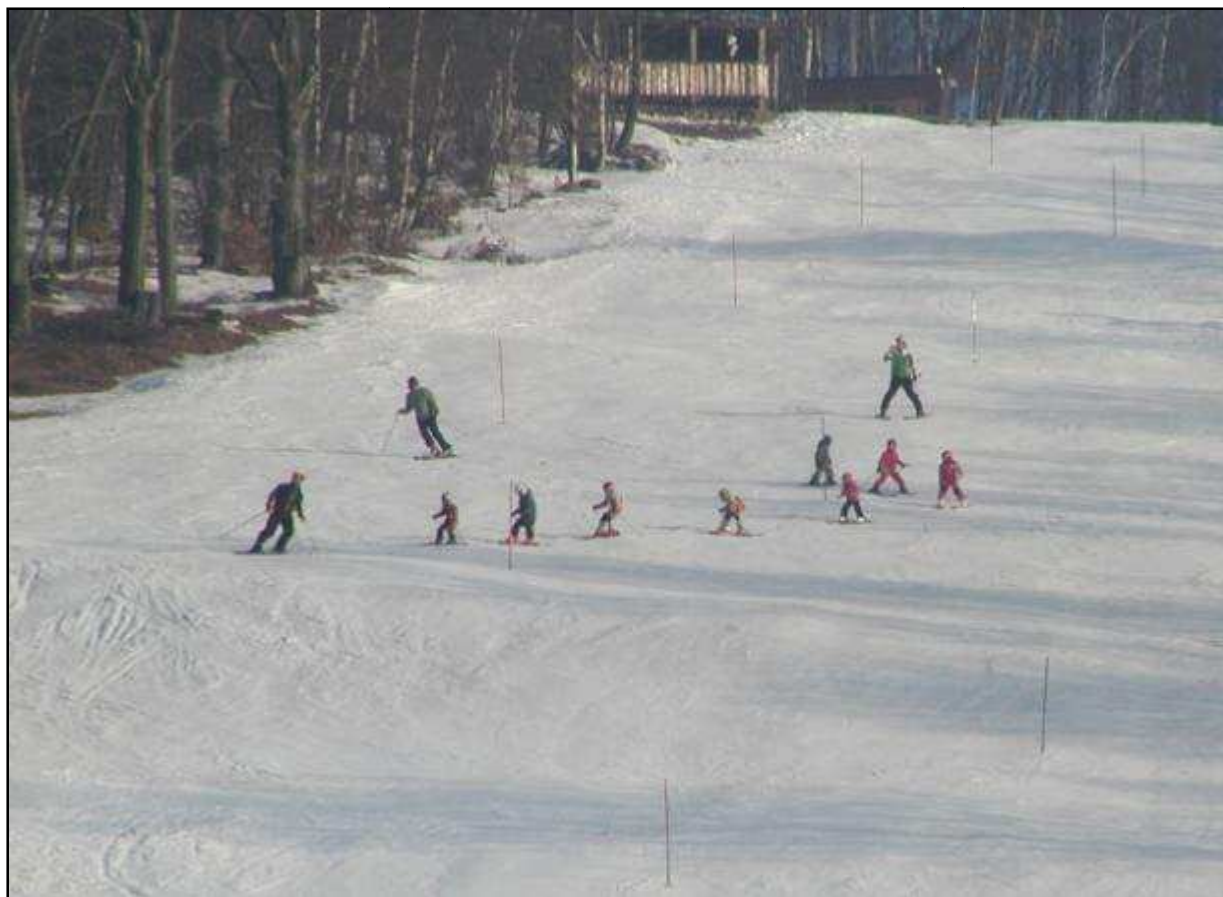
Trénink oddílu, 27.2.2011