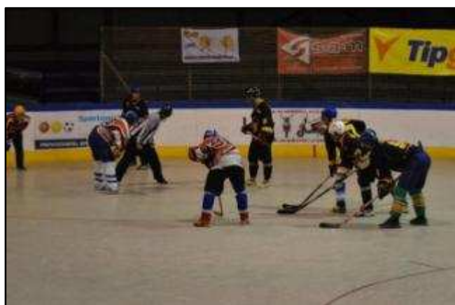
HBC Lev Litvínov - TJ Baník Meziboří

V září 2011 začal také další ročník soutěže OHbL SEVER, ve které došlo ke spoustě změn, jak ve složení jednotlivých týmů, tak v organizačních záležitostech celé soutěže. Dalo se čekat, že zápasy mezi Mezibořím a HBC Lev Litvínov, kam odešlo spousta hráčů Baníku, budou velmi vypjaté. Bohužel los přiřadil Baníku tento tým již v úvodním kole nového ročníku. Již první zápas měl tedy náboj play-off. Díky dobrému počasí byla i velmi