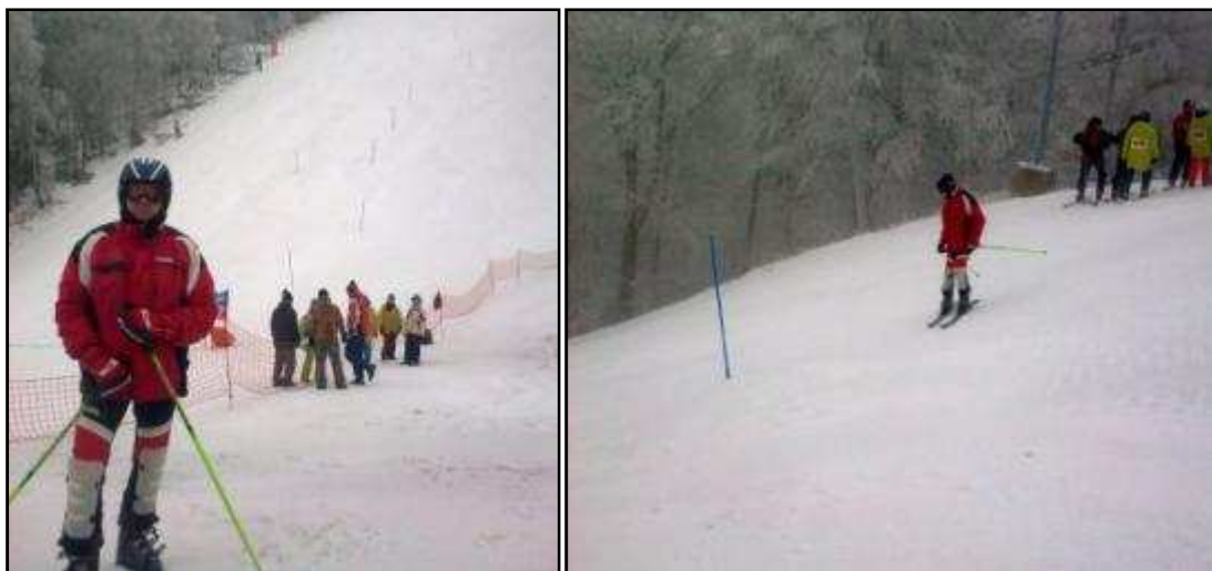
Přeboru Ústecké, Karlovarské a Plzeňské oblasti - slalom, 19.2.2011