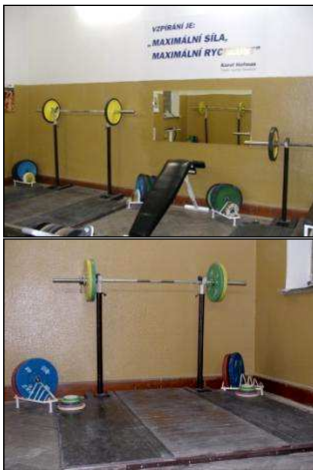
Vzpírárna ve sportovní hale Meziboří