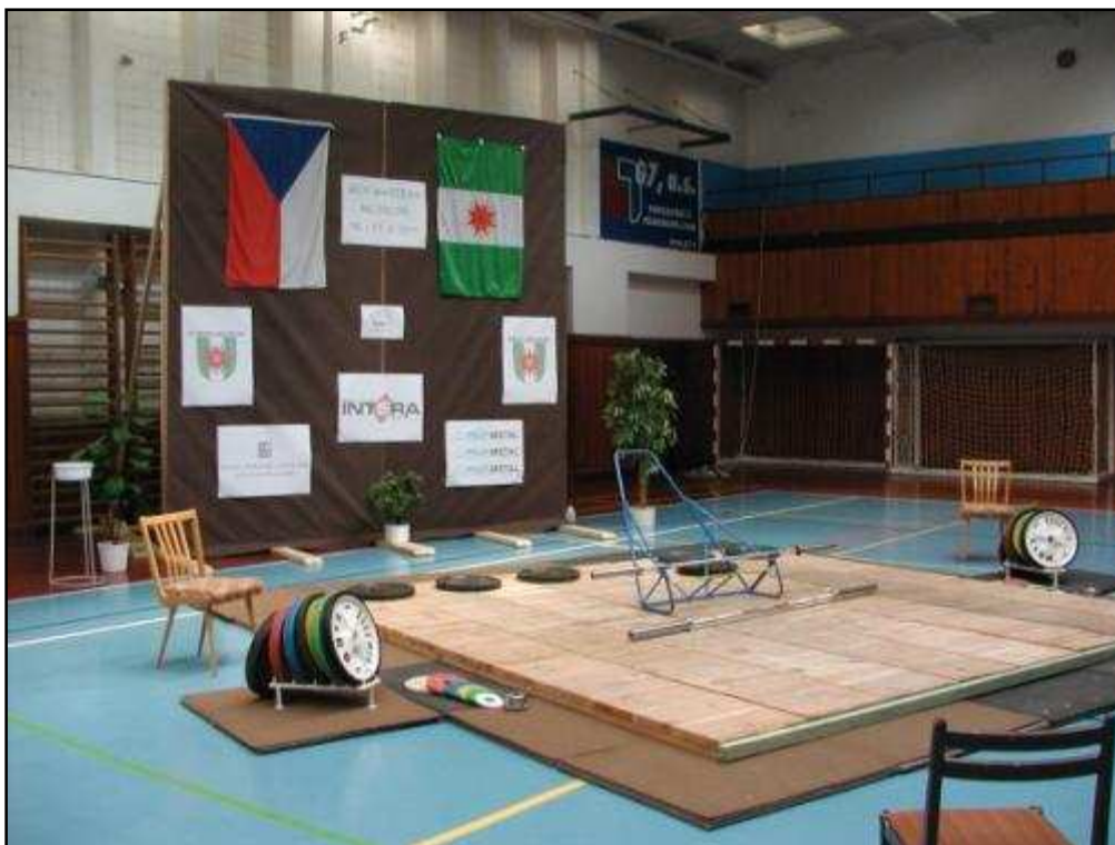
Obrázek 1 Připravené podium pro Mistrovství ČR Masters na Meziboří