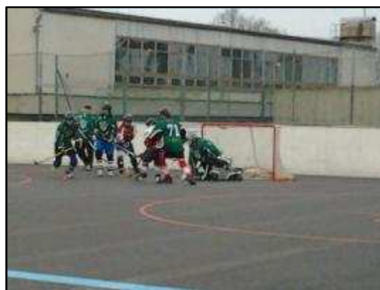
Orlík UnL - TJ Baník Meziboří

dobrá divácká účast a Baník jakoby chtěl dokázat hráčům, kteří odešli, že to nebyla správná volba a vyprovodil HBC Lev Litvínov s debaklem 5:0! Tento výsledek jakoby celý tým nakopl a úvod sezóny byl doslova pohádkový. Hned druhý zápas porazilo Meziboří loňského přemohitele v play-off HBC Bazy Děčín 3:2. Další skalp si připsal Baník po porážce nováčka v soutěži HBC Louny 2011, když vyhrál opět 3:2. Meziboří se drželo dlouhou dobu na nejvyšších příčkách tabulky, ale všichni věděli, že jednou musí přijít porážka a taky přišla. ELBA Ústí nad Labem byl první tým, který v 6. kole tohoto ročníku dokázal