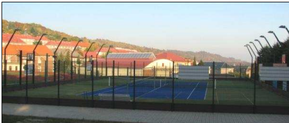
Osvětlené víceúčelové hřiště s umělým povrchem (nohejbal, volejbal, tenis)