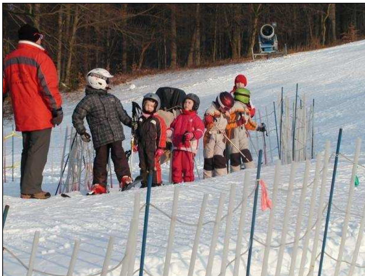
Trénink oddílu, 27.2.2011