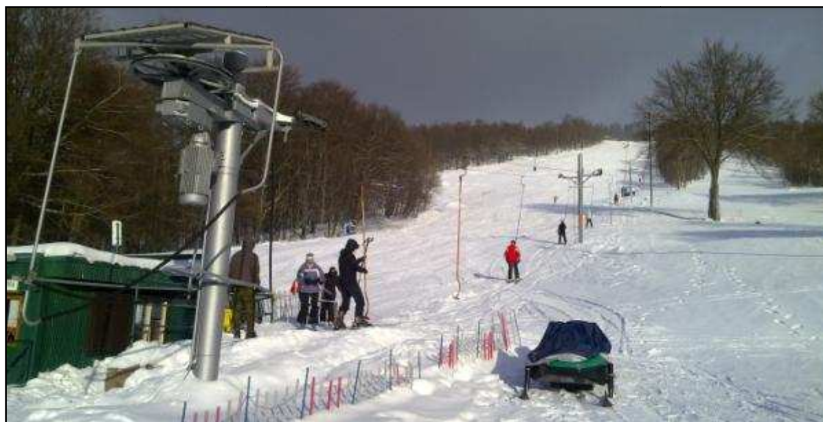
Lyžařský areál TJ Baník Meziboří