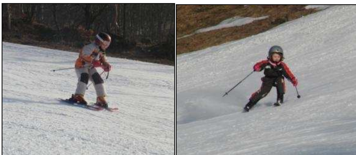
Trénink oddílu, 27.2.2011