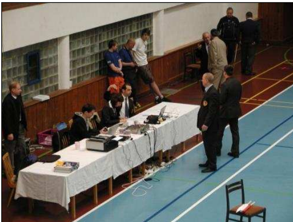
Obrázek 3 Technické zázemí pro rozhodčí - příprava na zahájení