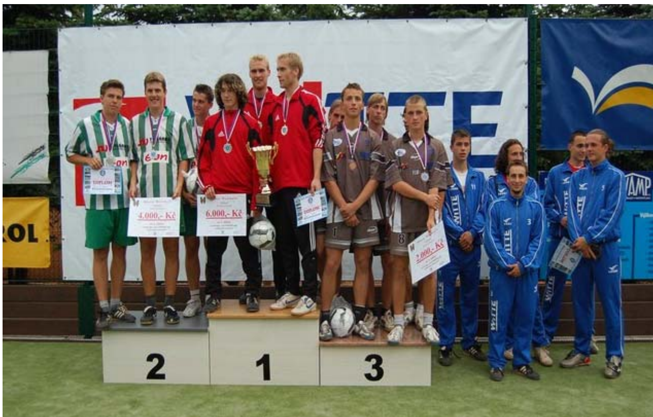
1. Kotlářka Praha, 2. Dynamo České Budějovice, 3. Sokol Prostějov, 4. Liapor Karlovy Vary