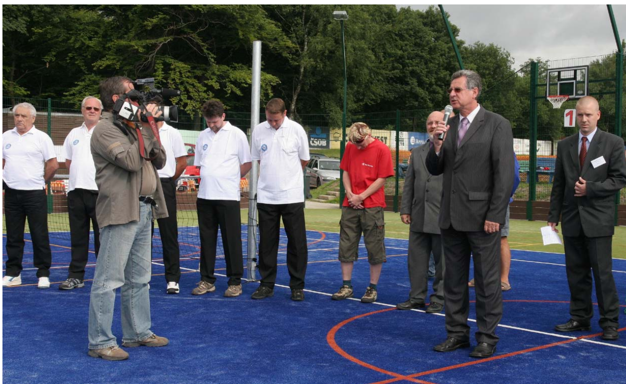
Slavnostní zahájení turnaje trojic, 30.6. 2007