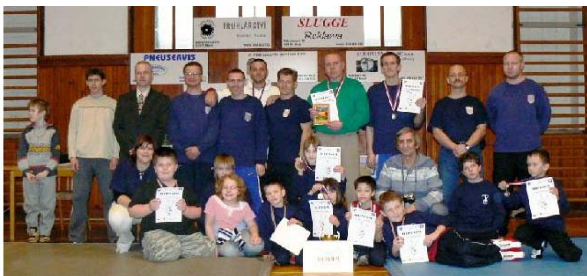
Druhé místo získal domácí oddíl Baník Meziboří se ziskem 47 bodů