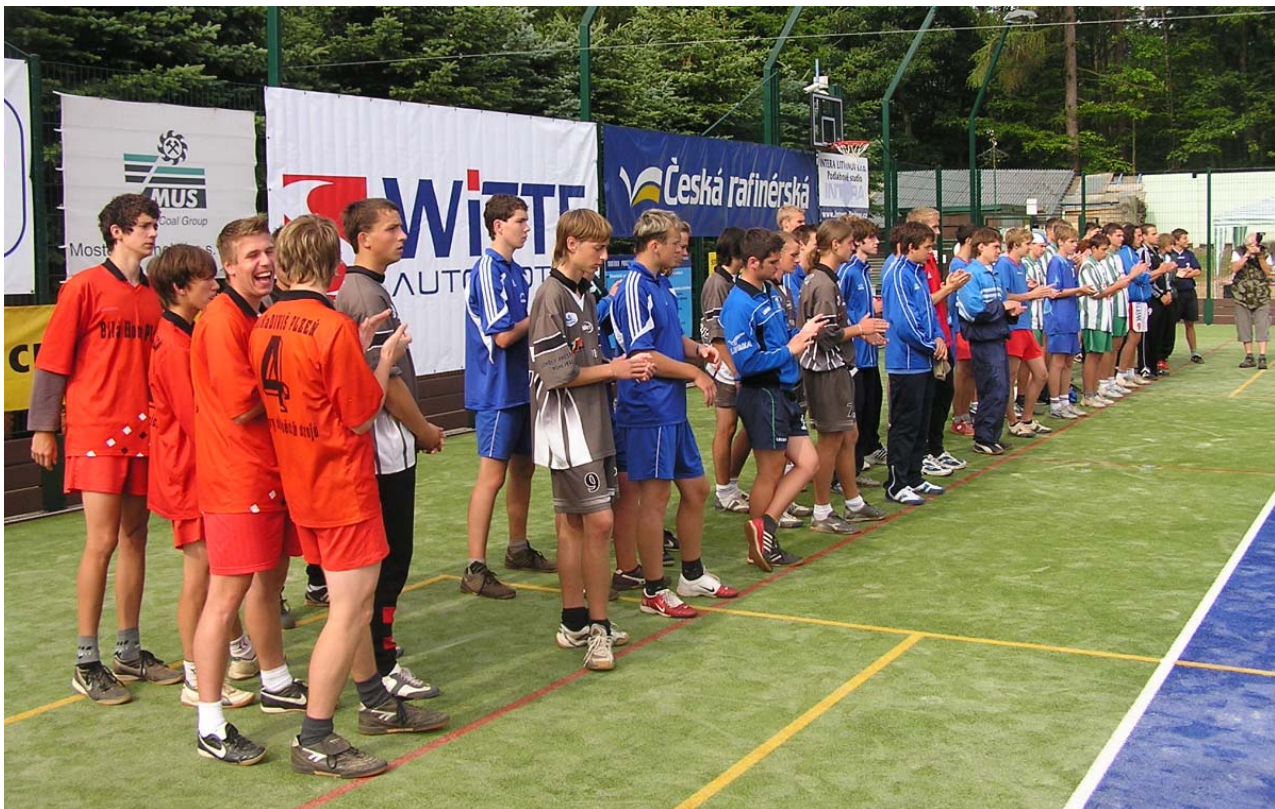
Slavnostní nástup turnaje dvojic, 1.7. 2007