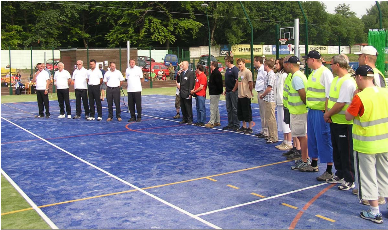
Slavnostní zahájení turnaje dvojic, 1.7. 2007