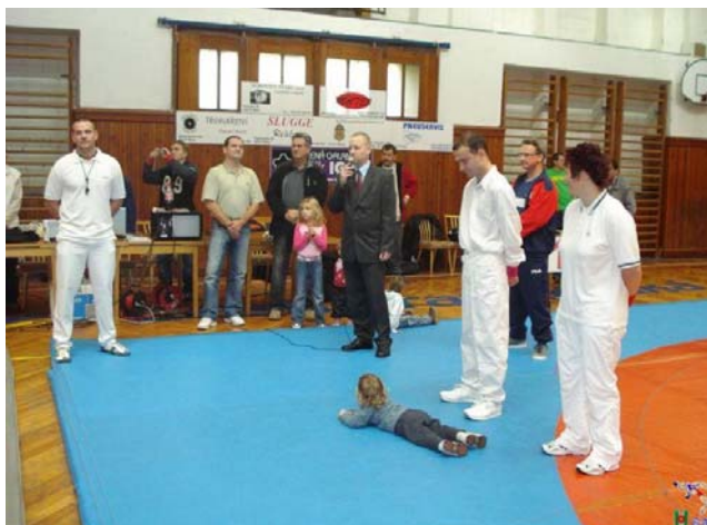
Slavnostní zahájení turnaje, 13. října 2007