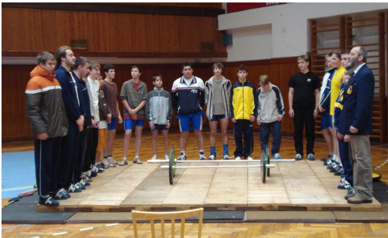
Slavnostní zahájení turnaje, 1. prosince 2007