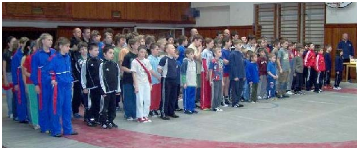
Slavnostní nástup závodníků, 24. března 2007