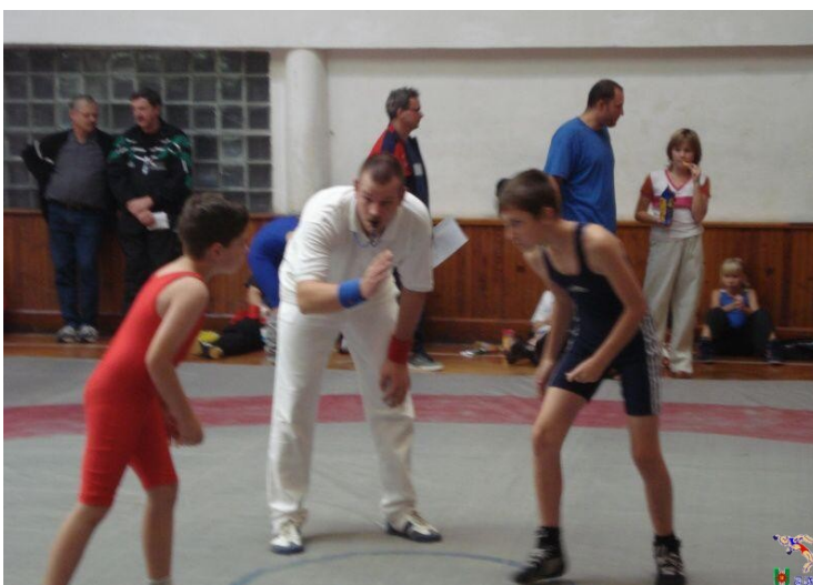
Zápasnická klání přípravy a mladších žáků