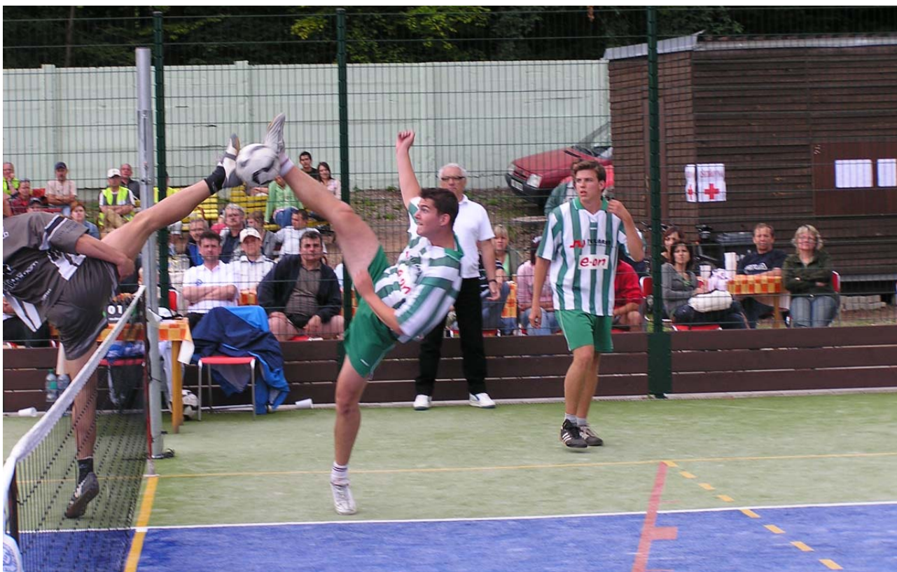
Semifinále turnaje trojic, Sokol Prostějov – Dynamo České Budějovice