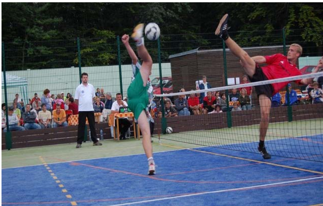
Finále turnaje trojic, Kotlářka Praha – Dynamo České Budějovice