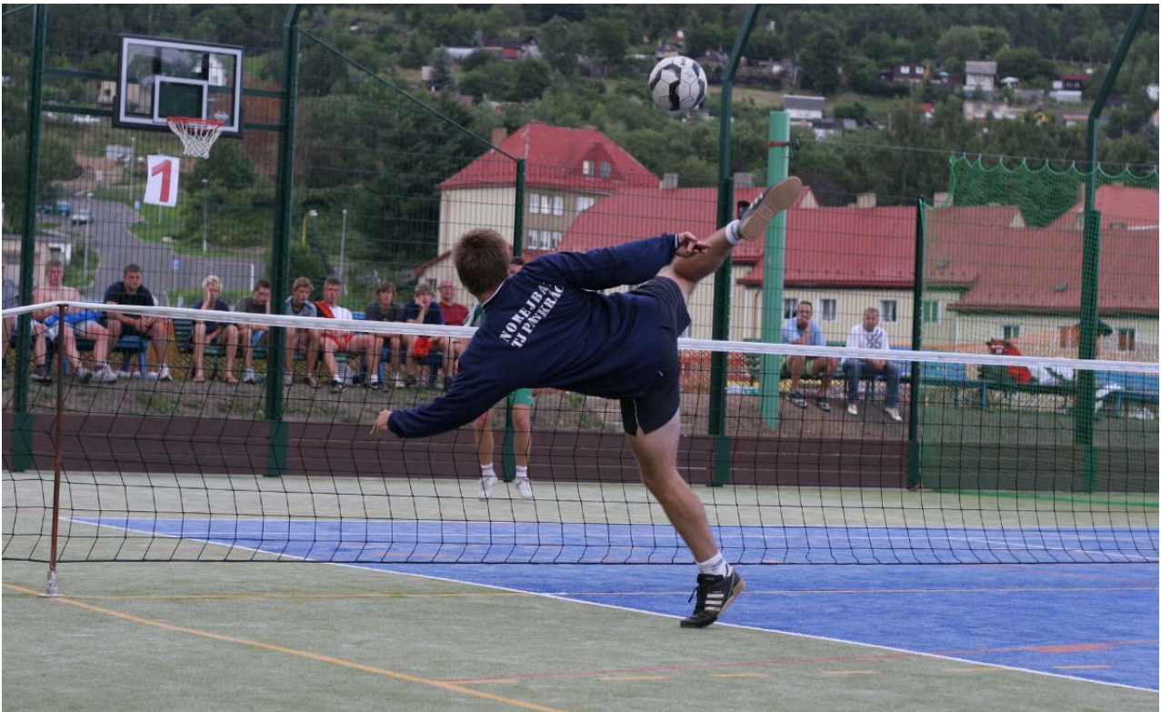
Finále turnaje dvojic, TJ Pankrác Praha – Dynamo České Budějovice