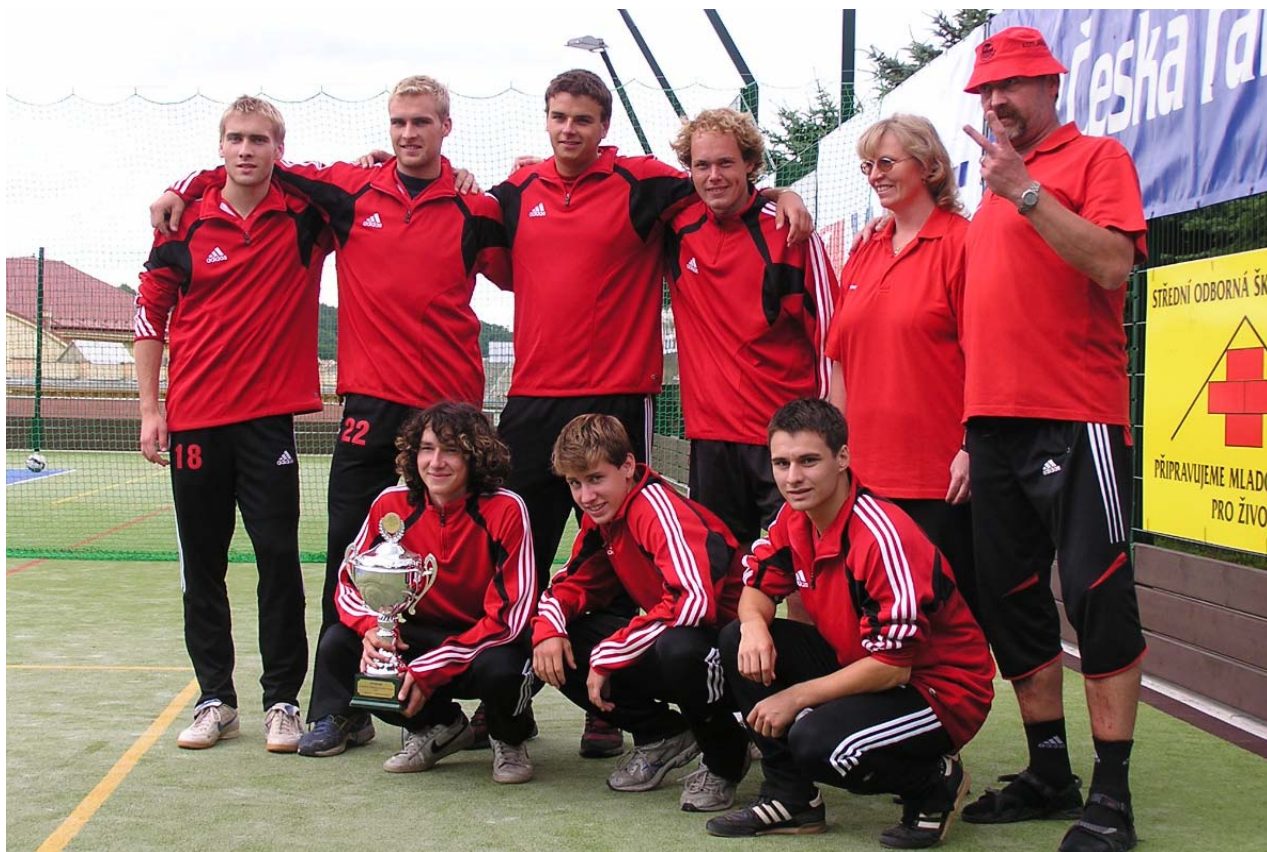
Mistr České republiky v kategorii trojic a zároveň vítěz Českého poháru družstev – Kotlářka Praha