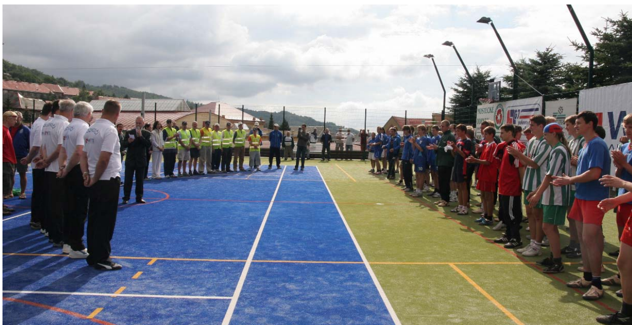
Slavnostní zahájení turnaje trojic, 30.6. 2007